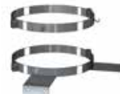
Gancho y pletina para módulo de medioambiente