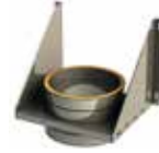
Soporte de carga regulable L=220 mm