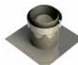
Adaptador FERRO a flex